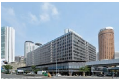
クリニックがある大阪第1ビルと周辺の風景

透析患者さんの快適な生活と社会復帰を支援する医療をめざし、グループ病院をはじめ地域の病院とも連携を図りながら、きめ細かな対応ができるよう体制を整えております。