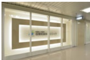
クリニックの入り口前